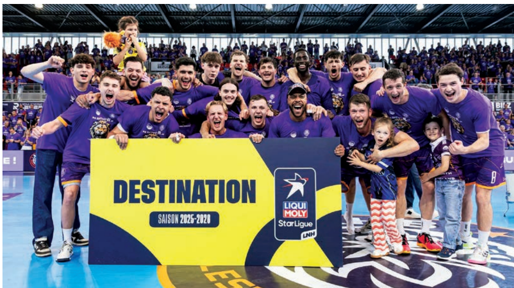
Bastion historique, le SAHB a remporté les play-offs de Proligue le 8 juin 2025 et accède à la Liqui Moly StarLigue.

notamment vis-à-vis des sponsors. Mais on a pu compter sur le gros soutien de nos partenaires... » résume-t-il.